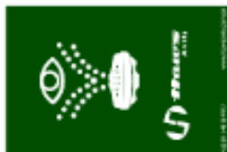
Placa de Sinalização